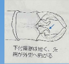
下付属器は長く、先端が外側へ向がる