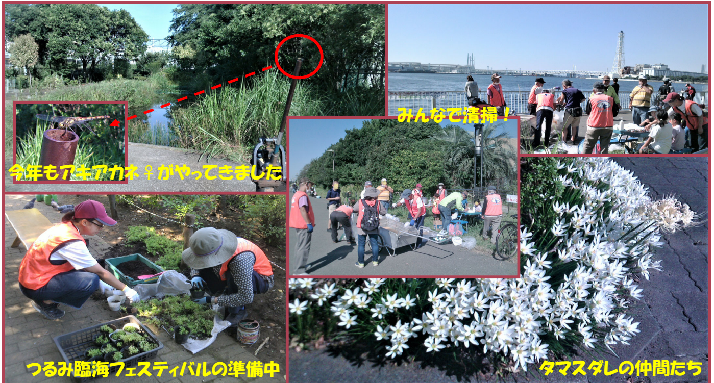
今年もアキアカネ♀がやってきました

久しぶりのトンボみちの月例活動(10/1)と、末広水際線プロムナードの清掃(10/2)の様子を今回もチョコッとだけお伝えします。