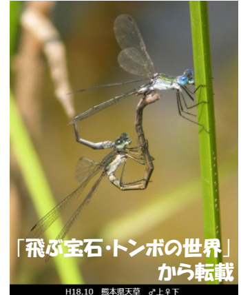
「飛ぶ宝石・トンボの世界」 から転載