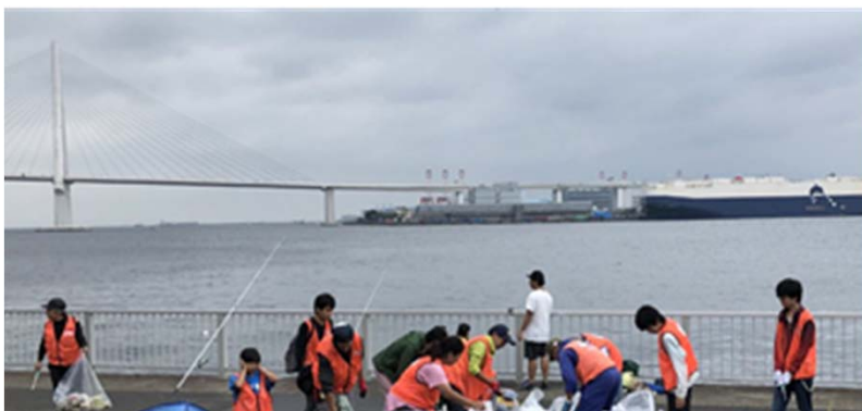
ゴミ分別作業の様子(2019.10)

課題がある。参加者は3倍に増えたが、ゴミは減 っていない。それどころか増えている。どうしたら