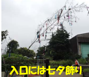
入口には七夕飾り