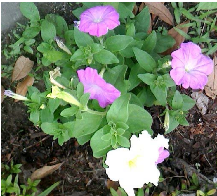
タネから育てたペチュニア(今年6月撮影)

さて、そんな計画を考えていますので、7月の活動日にはファンクラブのみんなで相談したいと思えます。特に、どんな花を育てるかが重要です。今までは、春から夏にかけて咲く花をタネから育ててみましたが、今回は 秋から春にかけて咲く花を育てることになりますので、初めてのチャレンジになります。 さあ、どんな花をタネから育てましょうか？ みなさん考えてきてくださいいね！