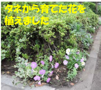
タネから育てた花を 植えました