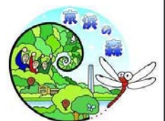
京浜の森ロゴマーク

※「JFEトンボみち」はJFEエンジニアリング(株)が 地域の皆様開放している公開緑地です