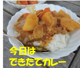
今日は できたてカレー