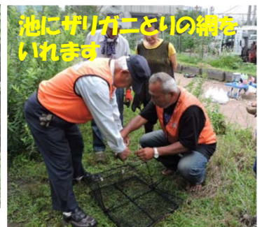
池にザリガニなどの網を いれます