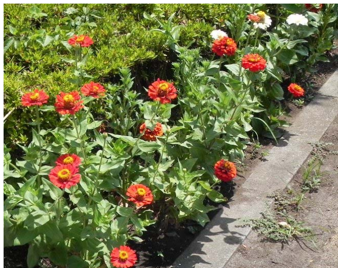
タネから大きく育った百日草(昨年8月撮影)

具体的には、 ①タネを播く花の種類を決める、②タネや必要な資材を購入する、(以前のフェスティバルで集まった募金を使います。) ③8月の活動日にタネを播く、④10月までファンクラブのみんなで育てる、 となります。