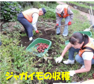
ジャガイモの収穫